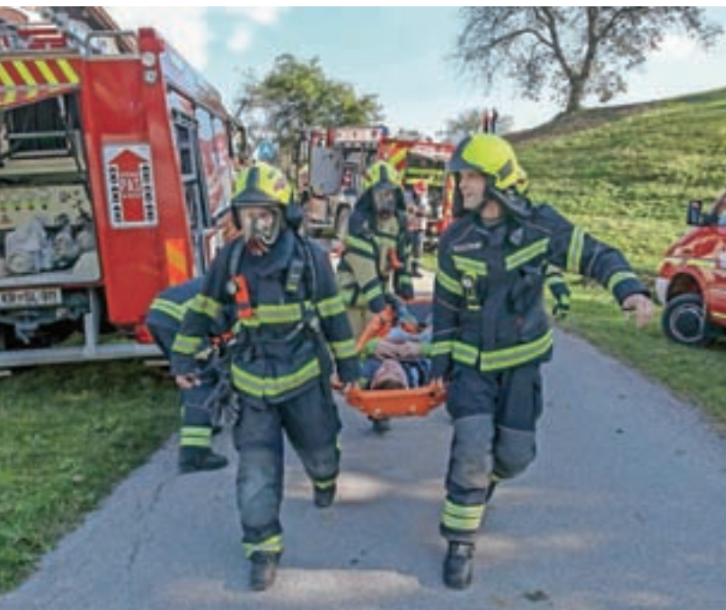
Prenos poškodovanca do triažnega mesta

je v primeru nesreč večjih razsežnosti izjemno pomembno štabno vodenje. Prav tako so z občino sklenili dogovor o petletnem financiranju gasilske dejavnosti, pripravljajo pa se tudi pravilnik o nabavi vozil ter osebne in skupne zaščitne opreme. Gasilci tudi v prihodnje pozdravljajo sodelovanje s Civilno zaščito, ki je aktivirana v primeru večjih nesreč, in se bodo z veseljem odzvali povabilu za sodelovanje na vaji v primeru, da jo bo organiziral štab Civilne zaščite, je bilo slišati v sklepu dogodka na trebijskem igrišču, na katerem so vse udeležence v zahvalo za sodelovanje pogostili s toplo malico.