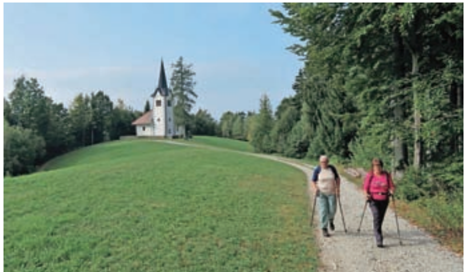
Pohodnika pred cerkvico sv. Primoža in Felicijana na Gabrški gori

Najprej so se mimo Kosmove domačije, kjer je bil leta 1851 rojen pisatelj Ivan Tavčar, povzpeli na Gabrško goro do cerkve, kjer je bila tudi najvišja točka