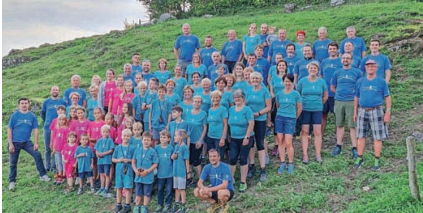
Prijatelji Slajke 2021