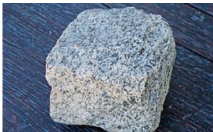
Granitna (ali granodioritna) kocka iz tlaka na mostu čez Soro

Glede na to, da je bil most postavljen leta 1956, v naslednjem desetletju pa so izvedli asfaltiranje glavne ceste po Poljanski dolini, granitni tlak na mostu ni bil dolgo v neposredni uporabi pa tudi prometa s težkimi vozili ni bilo veliko, zato so se kocke odlično ohranile. Tlakovanje z granitom zaradi njegovih lastnosti velja za enega izmed najbolj trpežnih. Če se površina posede, je kocke možno preložiti. Granit spada med magmatske kamnine. Najbolj razširjena in znana slovenska magmatska kamnina je pohorski tonalit, iz katerega je osrednji del Pohorja. V preteklosti so ga imenovali pohorski granit. Podrobne razi-