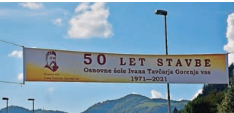
Transparent čez glavno cesto

V tem trenutku še ne vemo, kdaj bo zbornik našel pot med bralce in kdaj si boste lahko ogledali razstavljene fotografije. Počakajmo, da se bo pandemija umirila in da se bomo lahko zbrali brez strogih omejitev. Takrat bomo nadoknadili zamujeno in se poklonili petdesetletni šolski stavbi, predstavili zbornik in na njegovih straneh odkrivali njene skrivnosti in še nikoli zapišane stvari. Teh pa ni malo.