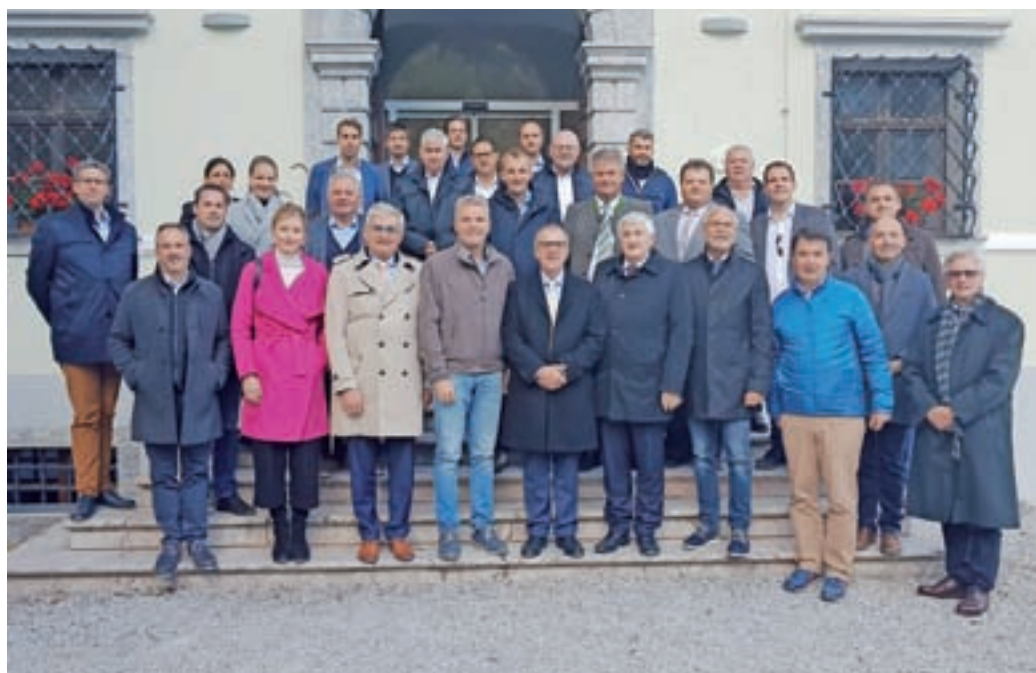
Delegacija županov iz sosednje Avstrije na Visokem

Skupaj so se nato odpravili na Visoko, kjer je po ogledu obnovljenega dvorca in razstavnih zbirk sledilo prijetno druženje