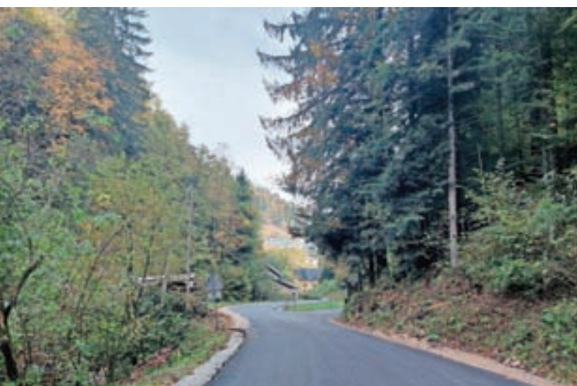
Saniran odsek ceste Talež–Javorjev Dol