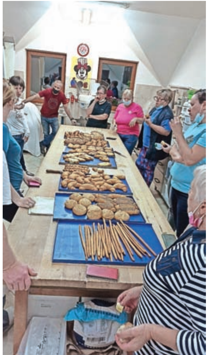
Po zaključeni peki v Karlovskem mlinu

znamko, ki obstaja že dvajset let, živi in se razvija dalje. Tudi zaradi tega in izjemne delavnosti ljudi mislim, da bo kmetijstvo na Škofjeloškem 'živelo' še dolgo."