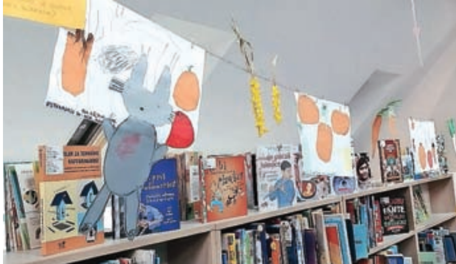
Na mladinskem oddelku razstavljajo otroci iz Vrtca Dobrava.