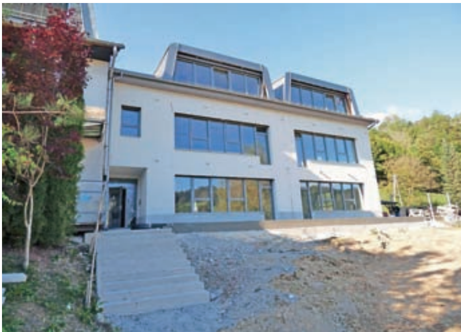
V Poljanah končujejo gradnjo novih prostorov vrtca Agata.