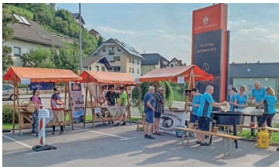
Predstavitve društev

informacije. Kar nekaj pa jih je spraševalo tudi o gastronomiji, kulturi in naravi. Skoraj vsako drugo soboto smo imeli pred Info točko tudi predstavitev različnih ponudnikov, od kmetij in aktivnosti do turističnih društev. Skupno je posamezne predstavitve obiskalo skoraj 150 ljudi. Upamo, da bomo tudi v prihodnje dobro sodelovali z lokalnimi ponudniki.