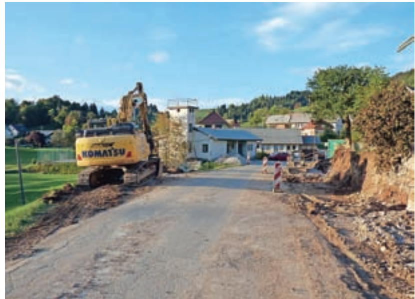
Rekonstrukcijska dela na cesti v Lučinah so se začela.

trase ceste. Izvedba se prilagaja ugotovitvam dejanskega stanja na terenu. Glede na kraško površje so možna presenečenja v obliki določenih praških pojavov, kot so jame in podobno, ki se bodo reševali sproti med izvajanjem del v sklopu geomehanskega, projektantskega in strokovnega nadzora.