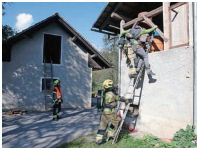
Reševanje poškodovanega iz gospodarskega posloja

je v primeru nesreč večjih razsežnosti izjemno pomembno štabno vodenje. Prav tako so z občino sklenili dogovor o petletnem financiranju gasilske dejavnosti, pripravljajo pa se tudi pravilnik o nabavi vozil ter osebne in skupne zaščitne opreme. Gasilci tudi v prihodnje pozdravljajo sodelovanje s Civilno zaščito, ki je aktivirana v primeru večjih nesreč, in se bodo z veseljem odzvali povabilu za sodelovanje na vaji v primeru, da jo bo organiziral štab Civilne zaščite, je bilo slišati v sklepu dogodka na trebijskem igrišču, na katerem so vse udeležence v zahvalo za sodelovanje pogostili s toplo malico.