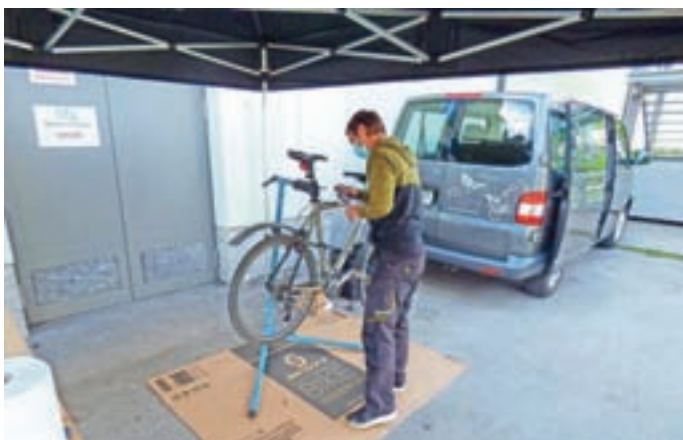
V Gorenji vasi so občanom omogočili brezplačen pregled koles.