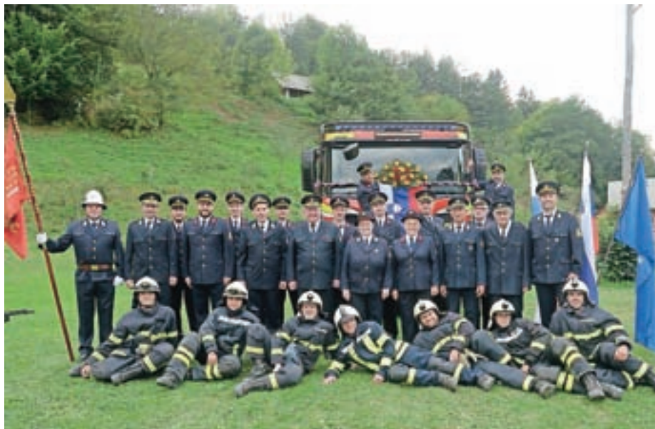
Člani PGD Hotavlje pred novim gasilskim vozilom