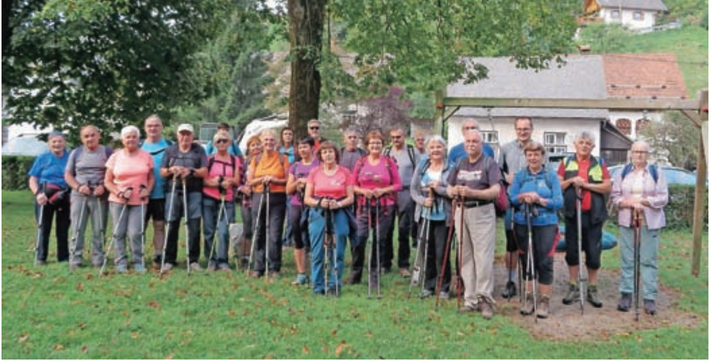
Udeleženci Jesenskega pohoda