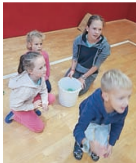
Učenke so malčkom obogatile Teden otroka.

September je bil v znamenju zlate barve, barve junakov 3. nadstropja. To so otroci in mladostniki, ki so preboleli ali prebolevajo raka. Njim, njihovim družinam, prostovoljcem in zdravnikom, ki so res junaki z veliko začetnico, smo se letos poklonili tudi mi. Konec septembra smo izpeljali dobrodelni tek Koraki z Junaki. Uspelo nam je z učenci prostovoljci z