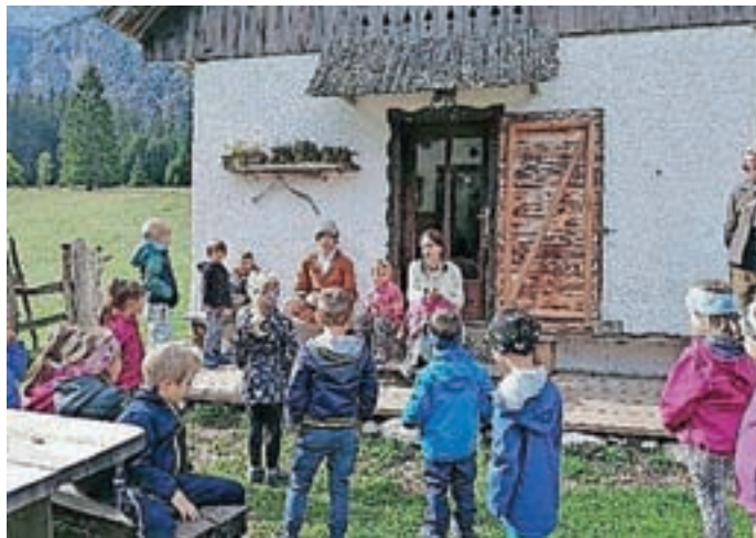
Otroci iz vrtca v Kekčevi deželi

Načrtovali smo, da bo leto 2021 posebej zaznamovano s praznovanjem visokega jubileja, a je pandemija marsikaj preprečila. Nekaj malega v poklon lepi abrahamovki pa smo vseeno uspeli realizirati. Nad glavno cesto vas pozdravlja ličen transparent z napisom 50 let šolske stavbe OŠ Ivana Tavčarja