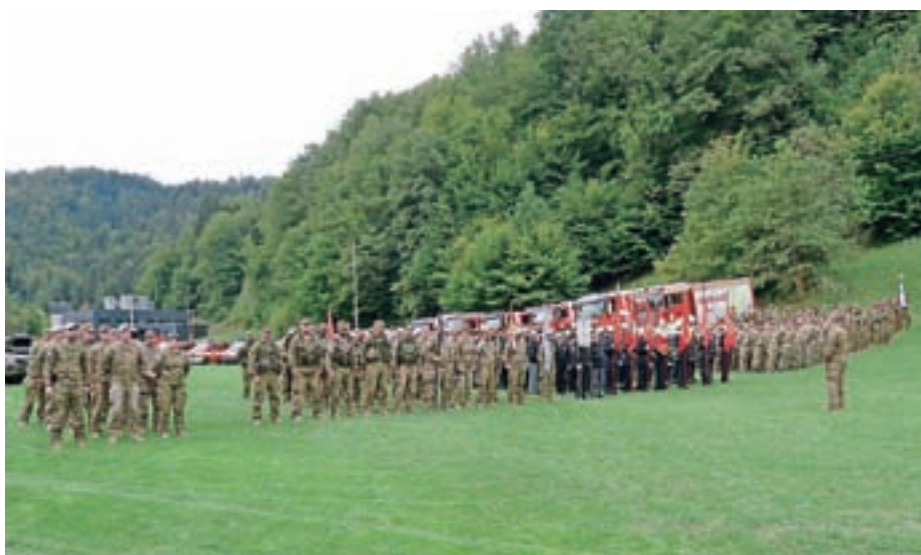
Postroj vojakov in gasilcev je pritegnil pozornost domačinov.

Hotaveljski gasilci se ob tej priložnosti zahvaljujejo vsem krajanom in podjetjem, ki so nakup vozila podprli s svojimi prispevki in so se po Potočnikovih besedah odzvali nad pričakovanji. Zahvaljujejo se tudi vsem, ki so sodelovali pri izvedbi predaje vozila, in Slovenski vojski za sodelovanje. Ugotavljajo, da se je civilno-vojaško sodelovanje v njihovem primeru izkazalo za zelo uspešno. Pridobitev novega vozila pa ni zaključek dejavnosti v društvu, saj že snujejo načrte za nadaljnji razvoj.