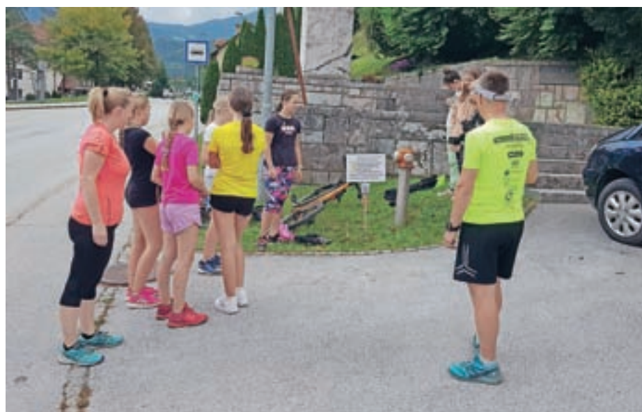
Tretja postaja dobrodelnega teka