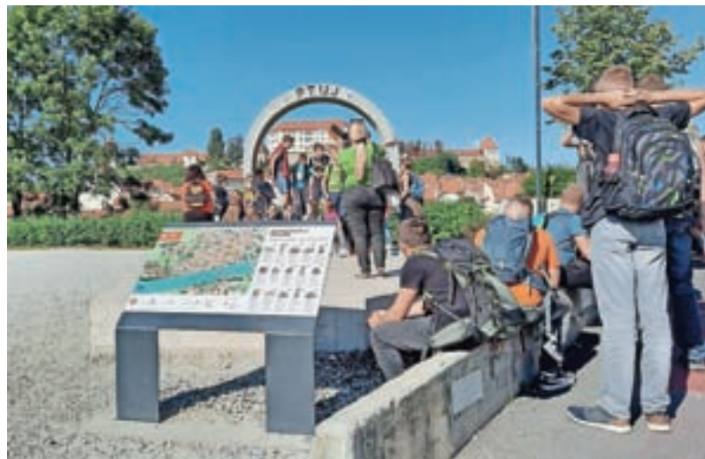
Osmošolci na Ptuj